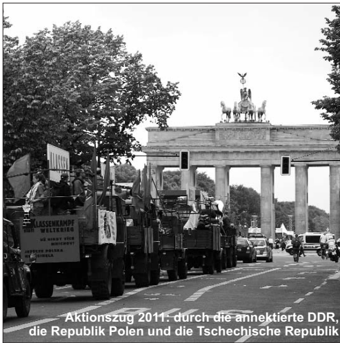
Aktionszug 2011: durch die annektierte DDR, die Republik Polen und die Tschechische Republik

haben den Handel, die einst großen, jetzt aber kleinen Fabriken, die weiten Landstriche in der Tschechischen Republik gesehen, jetzt in der Hand von VW, Commerzbank, Lidl, Aldi und von deutschen Großgrundbesitzern. Wir haben erlebt, wie deutsche Polizei bis weit nach Polen hinein unseren Zug der Warnung und Aufklärung gegen neue deutsche Okkupation begleitend schikanieren wollte, bis wir sie verjagt haben.